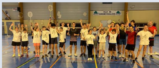
Session à Thorigné-Fouillard, le 21 juin 2023