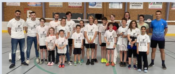
Session à Quintin, le 29 juin 2023