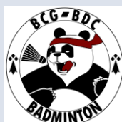
Badminton Club de Guichen Bourg-des-Comptes

https://www.ffbad.org/competitions/nationales/seniors/documents-utiles/les-interclubs-nationaux/