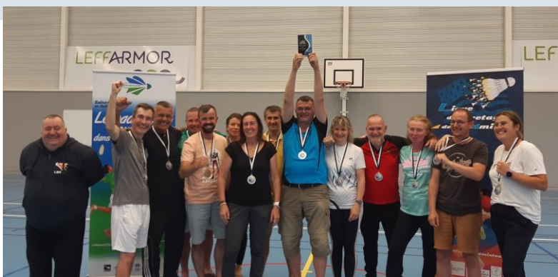
L'équipe du Comité Départemental du Morbihan, vainqueur de l'édition 2023

Prochaine édition : le 26 novembre 2023 dans le Morbihan !