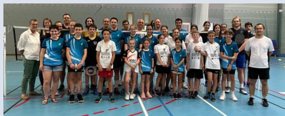
Session à Chateaubourg le 20 juin 2023