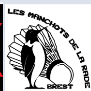
Les Manchots de la Rade