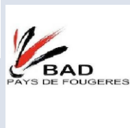
Badminton Club Pays de Fougères