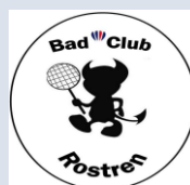
Badminton Club de Rostrenen