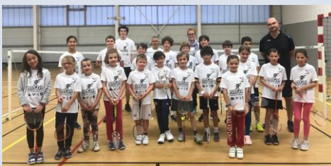
Session à Cavan le 03 juin 2023

Quelques photos des éditions de fin de saison :