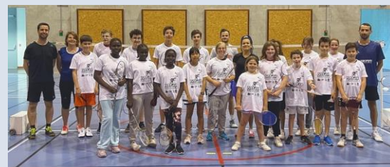
Session à Saint-Jacques le 02 juin 2023