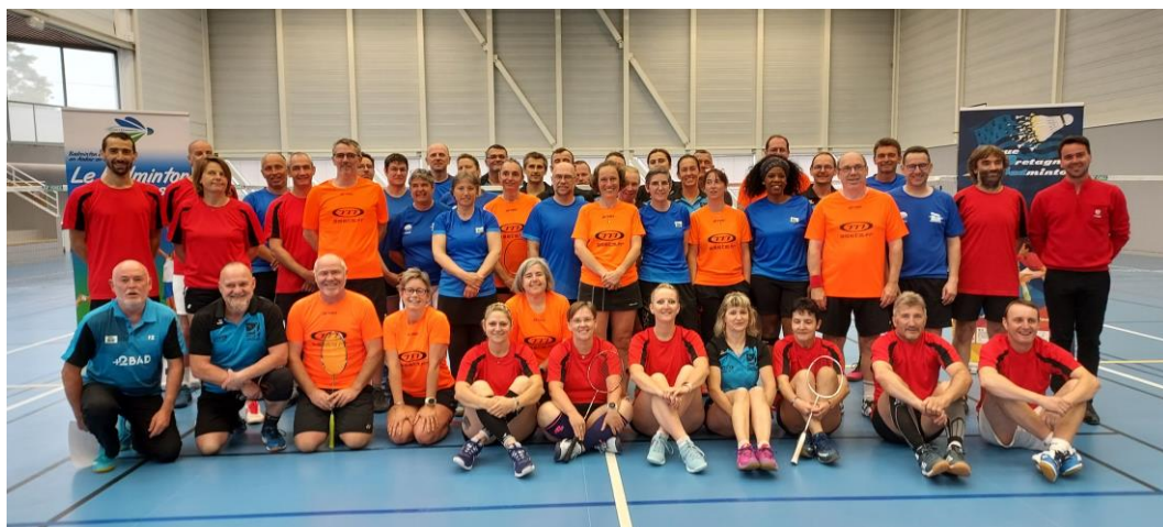
L'ensemble des joueurs des 4 Comités Départementaux